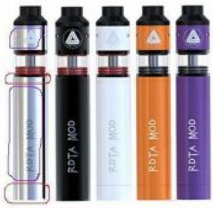
IJOY RDTA Mod